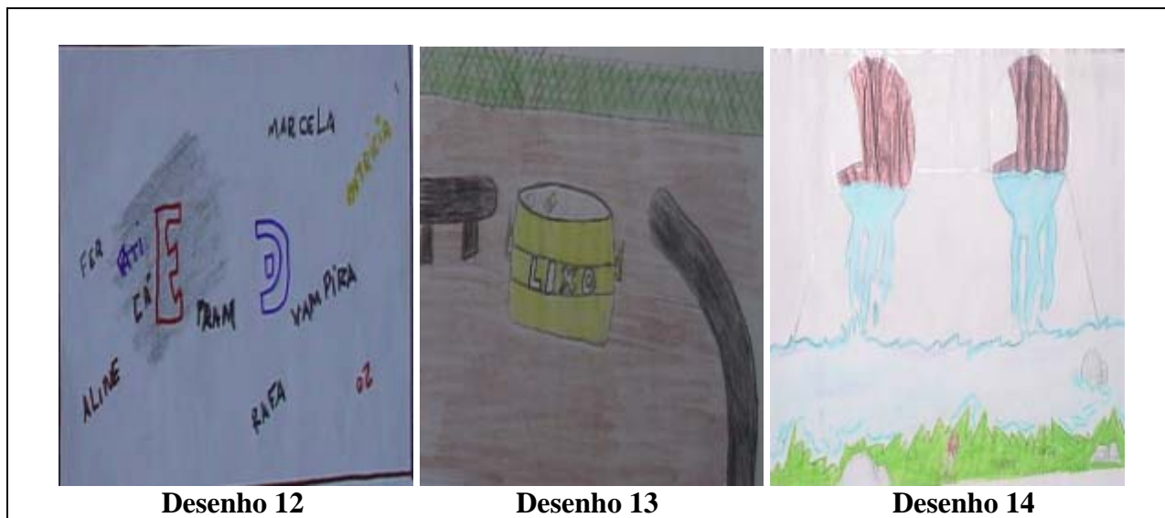
Figura 5: Desenhos representando a paisagem topofóbica do bairro

evocou suas lembranças e desenharam como “paisagem feia” o fundo do vale, com o rio e o esgoto, como ilustra o desenho 14 (Figura 5).