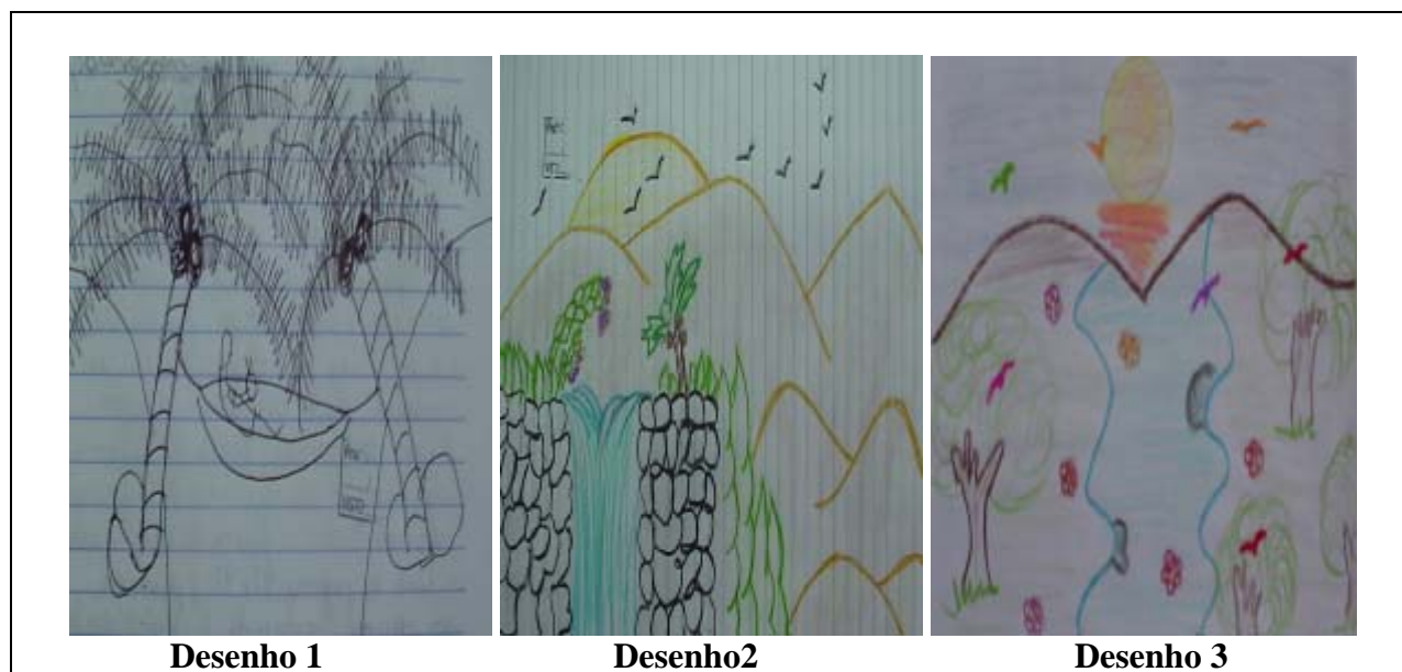
Figura 1: Desenhos da representação da “paisagem”